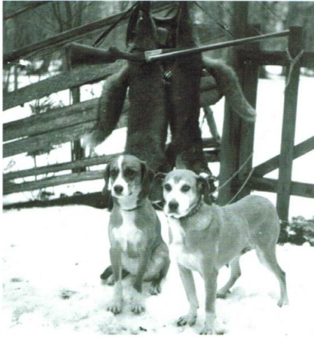
Gotlandsstövorna Spana och Klinga. Foto: Arvid Ohlsson, cirka 1953.

in i SKK:s register. På så sätt finns kompletta stamtavlor i registret. Nuvarande stam av gotlandsstövare baserar sig på 17 ursprungsdjur, eftersom alla hundar som mönstrades inte fick avkomlingar. För närvarande (2013) finns cirka 140 levande gotlandsstövare. Ett tjugofemtal av dessa finns på Gotland, övriga är spridda över resten av Sverige utom tre som finns i Norge och två i Tjeckien.