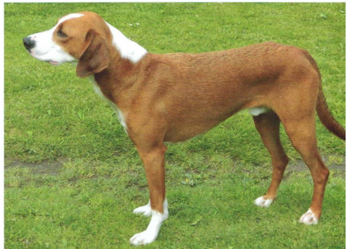
Vire, typisk gotlandsstövare.

Till skillnad från andra husdjur (ex. hästar, kor och grisar) som kan hållas i djurparker, bygger hundhållning på att hunden är en medlem av familjen. Man är alltså helt beroende av att enskilda människor vill ha en hund av rasen i fråga. Samtliga svenska hundraser är från början nyttodjur (jakt-, vakt-, och/eller vallhund). Ska de svenska raserna överleva måste det finnas behov av den funktion som hunden är avlad för. Alternativt kan man inrikta aveln för att täcka andra behov som kan finnas i framtiden, men då får man så småningom en ny ras. Framtiden för gotlandsstövaren är alltså ganska oviss. Men som man brukar säga: "Det är svårt att sia, särskilt om framtiden."