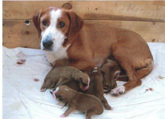
Raja med valpar 2013.

Trots gotlandsstövarens krokiga historia, så finns rasen ännu kvar. Mot alla odds. Hur mycket dagens hundar skiljer sig från de gotlandsstövare som fanns på 1800-talet är svårt att säga. Vad man kan säga är att många av hundarna i rasen så påtagligt skiljer sig från hundarna i övriga stövarraser, att det uppenbart är av annan stam. Detta gäller inte bara färgen, som är det tydligaste yttre kännetecknet för