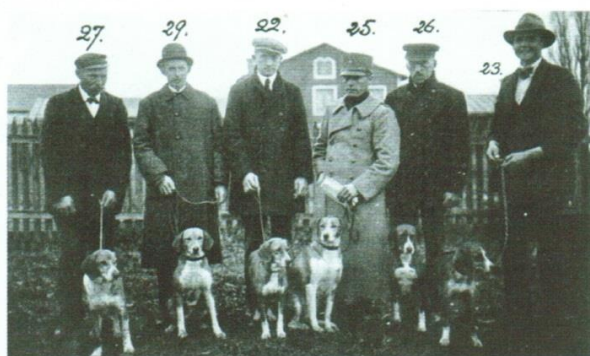
Från en hundutställning i Visby 1922. Sex gotlandsstövaretikar som tog 1:a pris.

1988 bildades Föreningen för Gotlandsstövarens bevarande av några entusiaster som såg sin ras hotad. Namnet ändrades vid årsmötet 1996 till Gotlandsstövareföreningen. Föreningens mål är att befästa och bevara gotlandsstövaren som en egen livskraftig ras och att främja ändamålsenlig avel och god vård av mentalt sunda, jaktligt och exteriört fullgoda, gotlandsstövare. Rasföreningen initierade tillsammans med Svenska Stövarklubben och SKK mönstringar i början av 1990-talet. Totalt inmönstrades 35 hundar i rasen och SKK återupptog registrering av rasen under en försöksperiod på 10 år, som senare utsträcktes till 15 år. Under 2007 slutade SKK att registrera rasen, med motiveringen att aveln inte var i enlighet med SKK:s avelspolicy. Under 2007 och 2008 år registrerade Gotlandsstövareföreningen själva de hundar som föddes, och verkade samtidigt, tillsammans med Svenska Stövarklubben, för att rasen åter skulle erkännas av SKK. Så blev även fallet, så från 2009 registrerar SKK gotlandsstövare igen. De hundar som rasföreningen registrerade 2007-2008 fördes retroaktivt